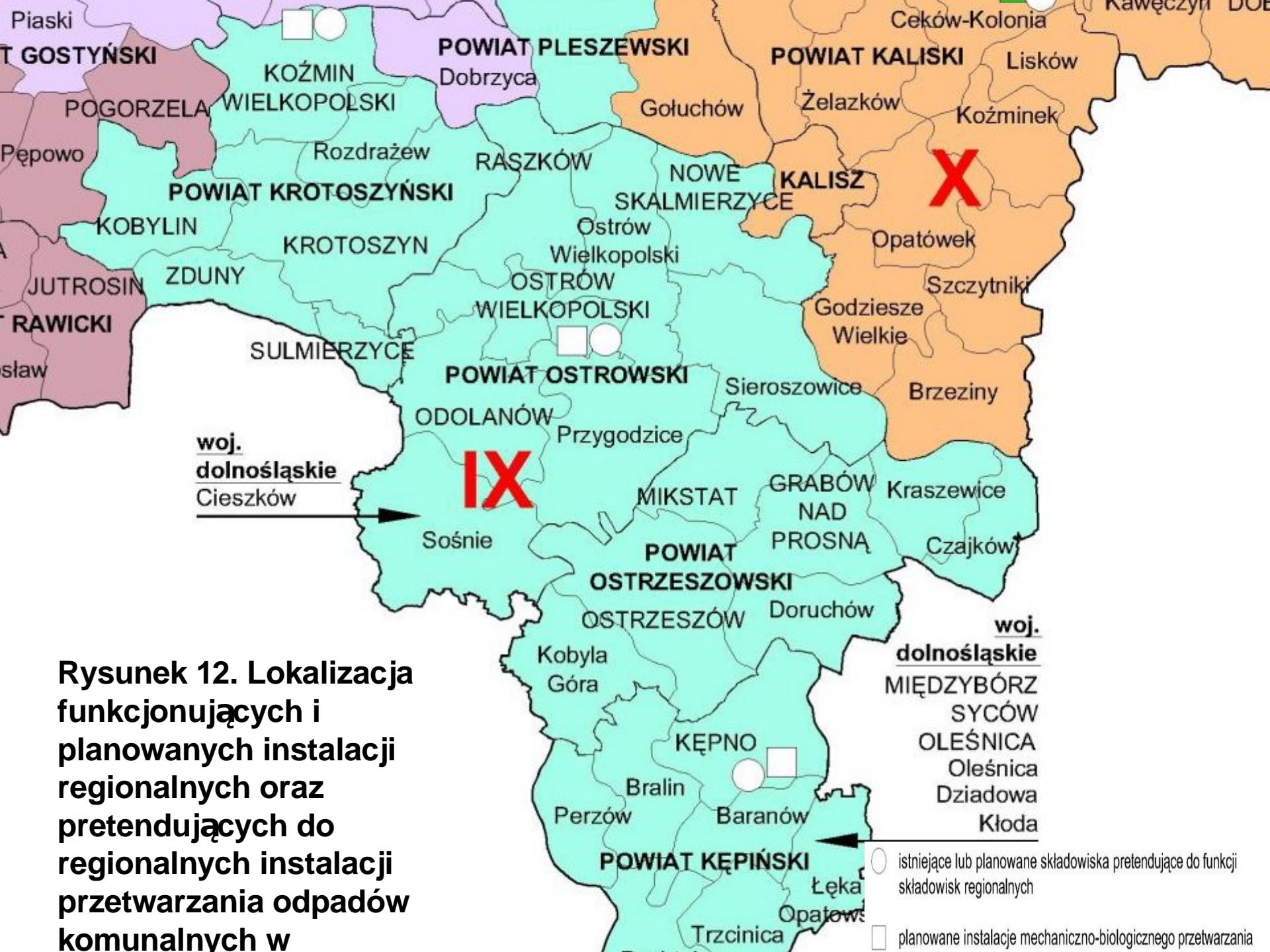
Rysunek 12. Lokalizacja funkcjonujących i planowanych instalacji regionalnych oraz pretendujących do regionalnych instalacji przetwarzania odpadów komunalnych w